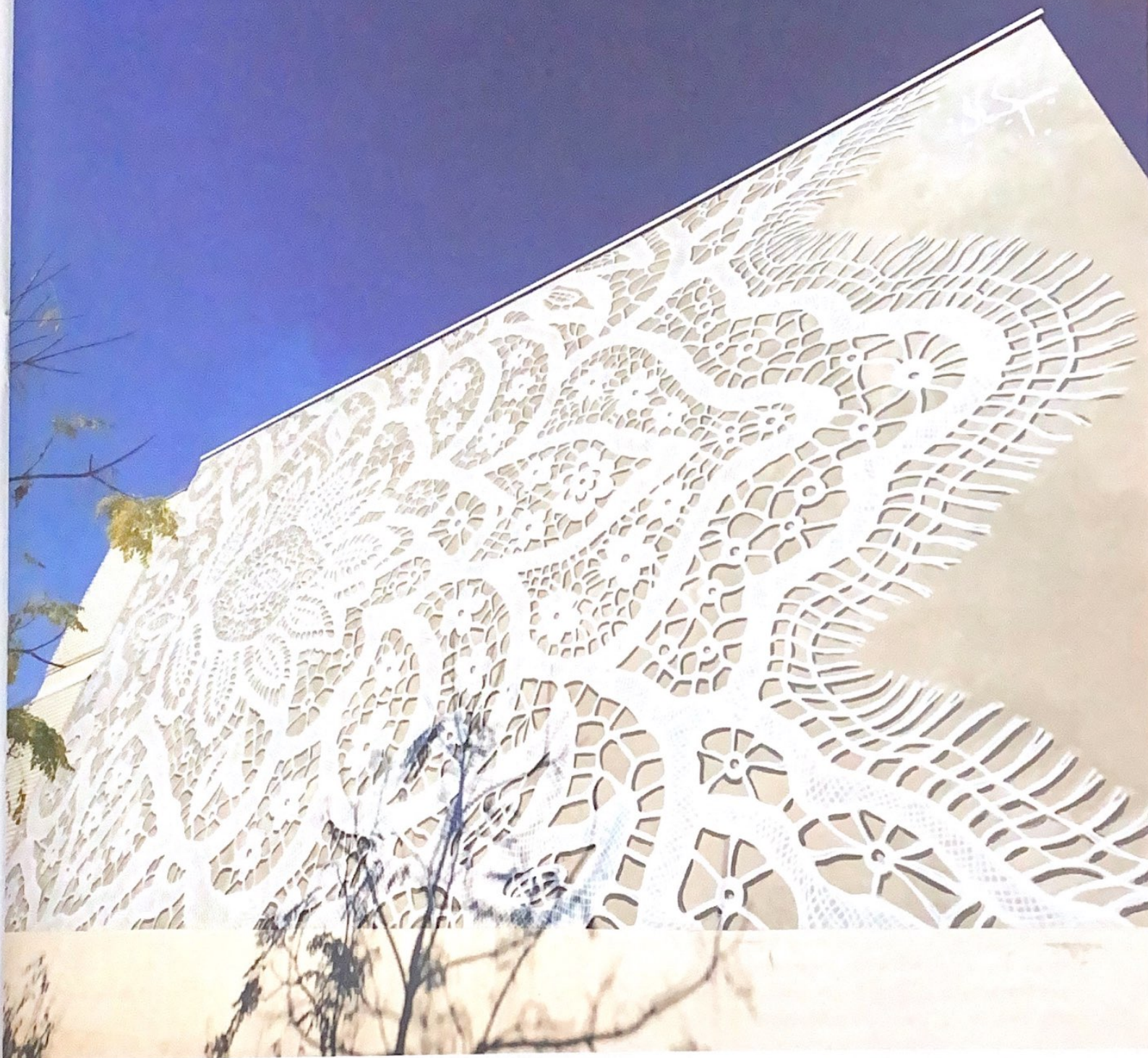
La façade "dentelle" de Silk