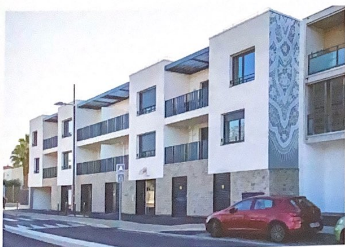
Une façade de la résidence Silk à Castelnau-le-Lez