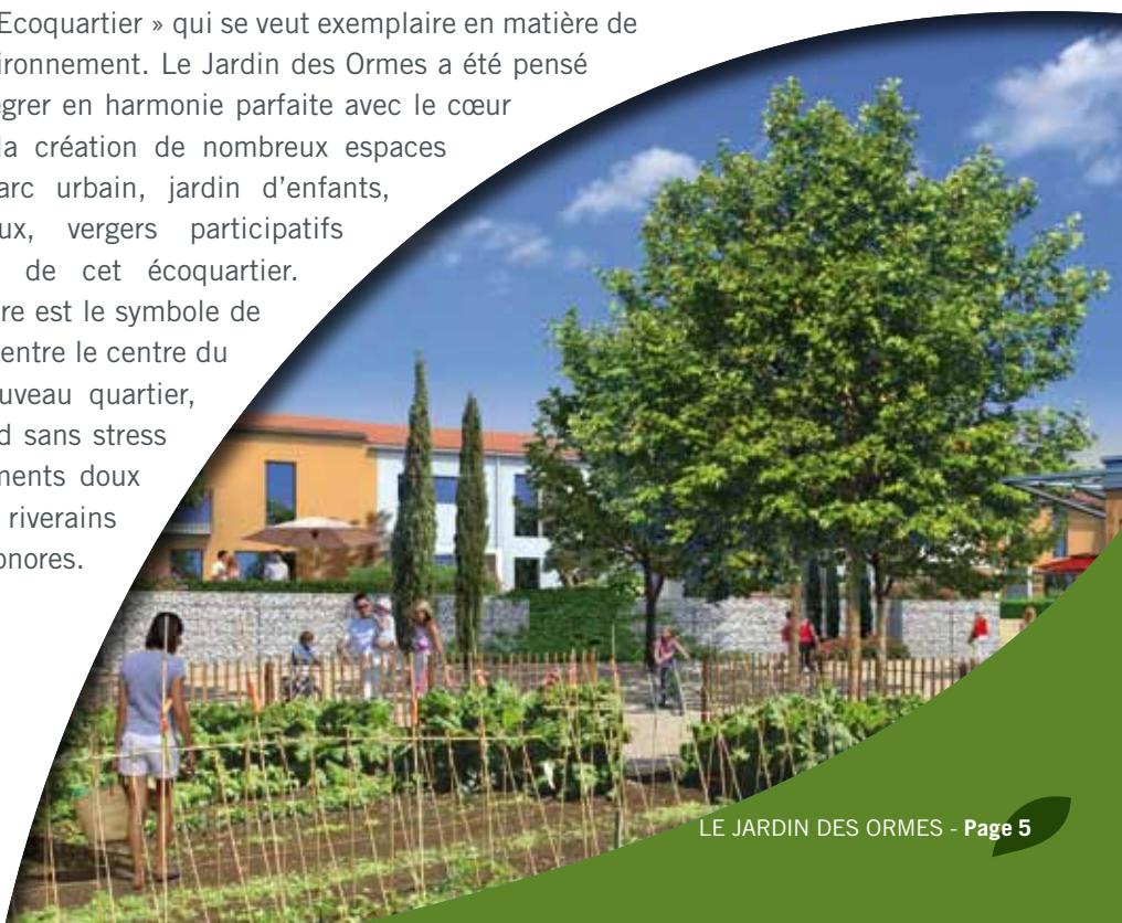
Les jardins familiaux

Le Jardin des Ormes a été conçu pour le bien-être de tous et plus particulièrement des enfants en pensant à leur avenir. Ce projet d'aménagement s'inscrit dans une démarche d'obtention du nouveau label « Ecoquartier » qui se veut exemplaire en matière de respect de l'environnement. Le Jardin des Ormes a été pensé pour venir s'intégrer en harmonie parfaite avec le cœur du village par la création de nombreux espaces végétalisés : parc urbain, jardin d'enfants, jardins familiaux, vergers participatifs insufflent l'esprit de cet écoquartier. Le groupe scolaire est le symbole de cette continuité entre le centre du village et le nouveau quartier, on circule à pied sans stress et les cheminements doux préservent les riverains des nuisances sonores.