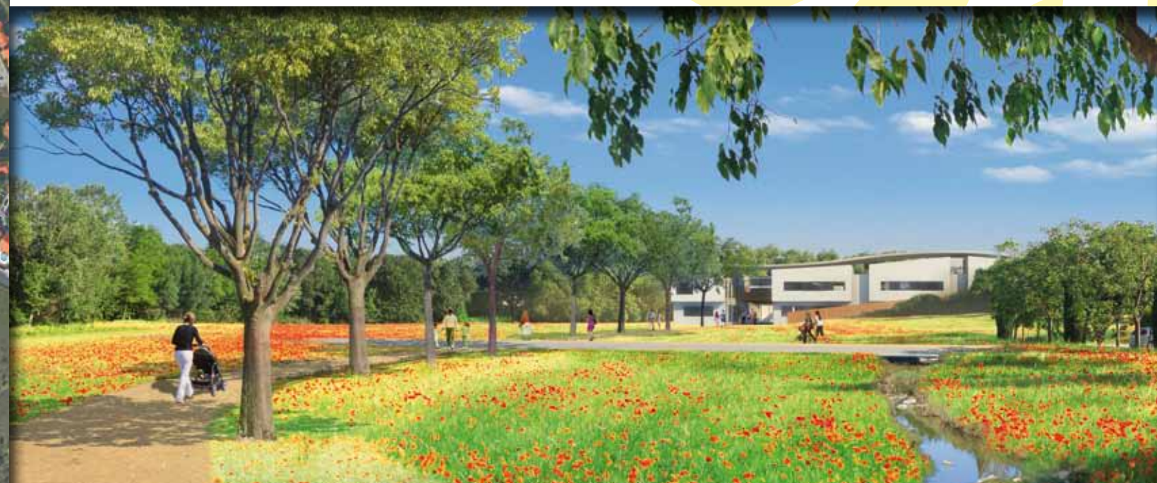
Vue du Parc public

Une démarche de développement durable au service des générations futures